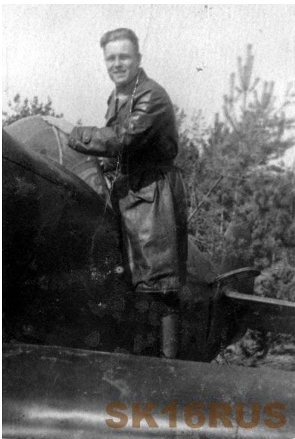
На крыле ЛаГГ-3, надпись на обороте: «20.04.42 Москва»