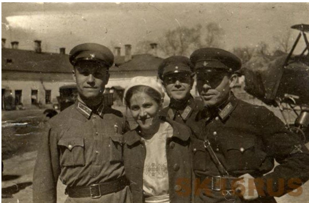
С женой и друзьями 30-е годы