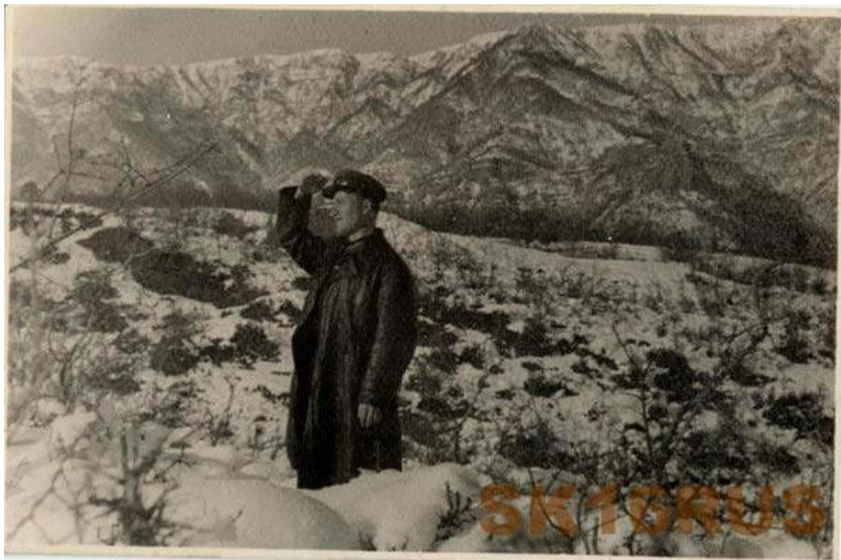
Вероятнее всего – Ялта, конец 30-х – начало 40-х гг.