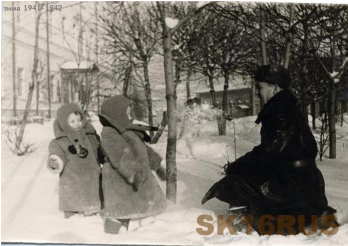
В отпуске в Казани. Зима 1941-1942 гг.