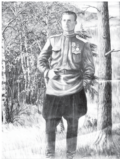
Портрет П.И. Шакуна, написанный с его фотографии

Работники музея поблагодарили за ценную информацию, пообещали передать данные родным и, в свою очередь, обещали прислать портрет П. И. Шаку-