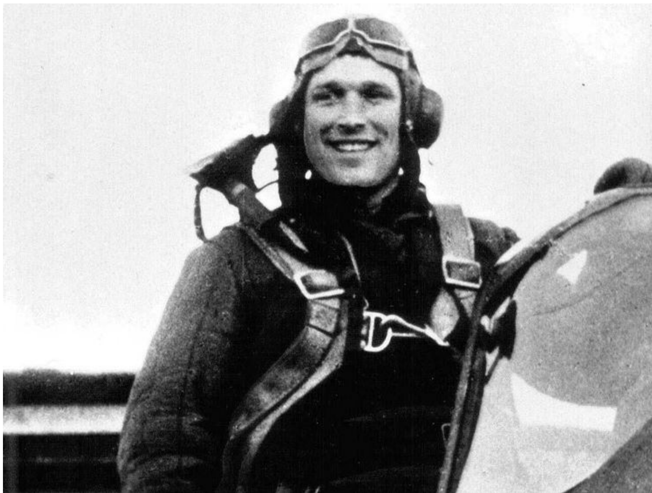
Борис Сафонов в кабине своего «киттихаука».